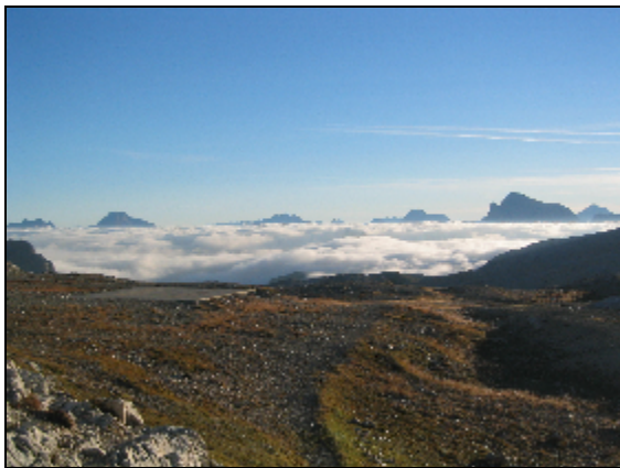
Blick von der Rosetta-Hochfläche

Hoch: 900 Hm Runter: 900 Hm Gehzeit: 6 ½ Stunden