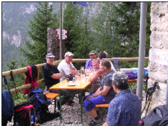
Entspannung am Rifugio Treviso