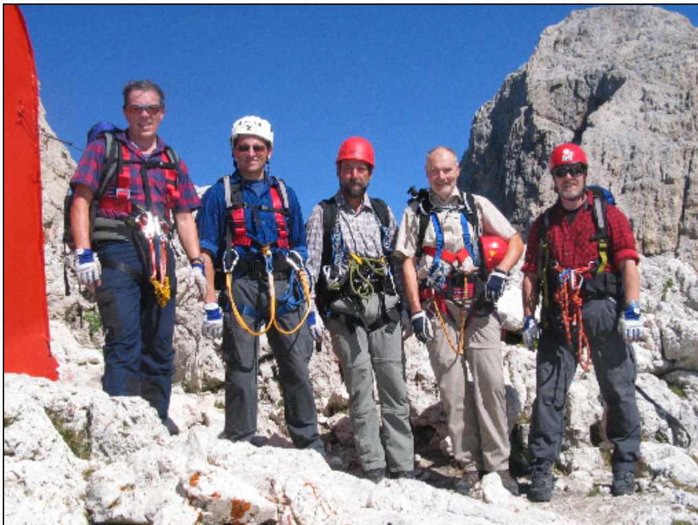
Aufgenommen am Bivacco Fiamme Gialle (3.005m)