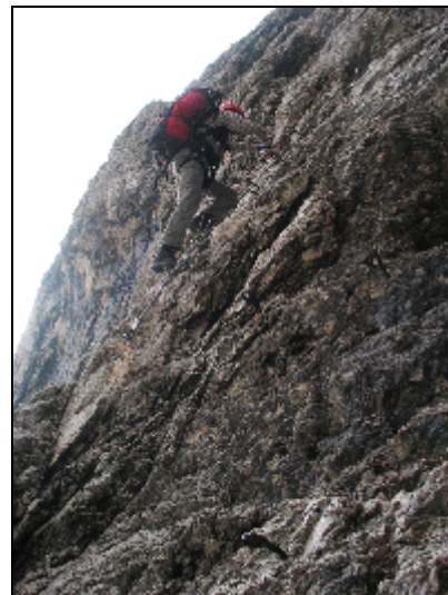
Einstiegswand der Ferrata Porton