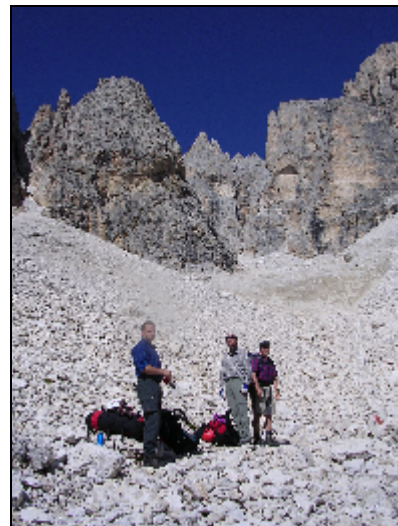
Val Strut – Nähe Bivacco Brunner

In gleichmäßigem Aufstieg durch das Val Strut erreichen wir recht schnell das Bivacco G. Brunner (2.669m). Zwei Belgier befinden sich etwas vor uns mit gleichem Ziel. Schweißtreibend geht es immer steiler bis zum Passo di Val Strut (2.870m). Wir machen erst einmal eine Pause und schauen auf das teilweise vereiste Stück der Via ferrata Gabitta d'Ignoti. Von oben steigen ein paar Bergsteiger ab. Oh Gott, sieht irgendwie kompliziert aus! Kommen im Abstieg kaum vorwärts. Sollen wir schon wieder zur Umkehr gezwungen sein? Wir machen einen Versuch. Völlig problemlos! Waren einfach nur unheimliche Experten, die da rumgeturnt sind.