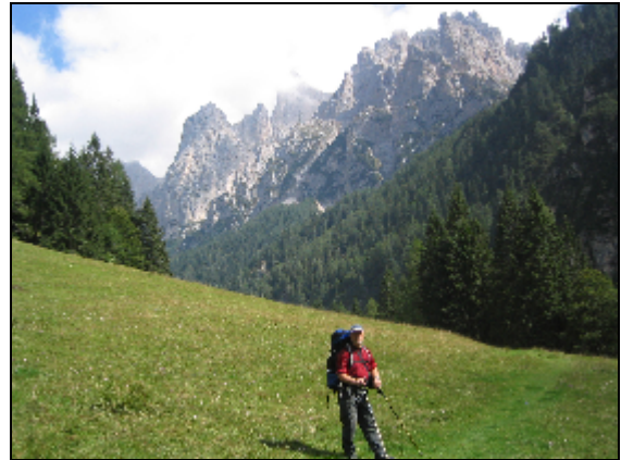
Im Val Canali