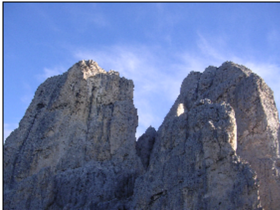
Sass Maor (2.814m)

Eine Reihe von Eisenkrampen am dunklen, senkrechten Fels eröffnet die Route. Luftige Traversen schwenken schließlich hinaus in den exponierten südostseitigen Wandfels der Cima di Ball. Schließlich mündet der Steig in heikler Abwärtsquerung in die düstere Geröllschlucht, die von der Forcella Porton herabkommt. Schweißtreibend geht es steil hinauf über Sand, Schotter, grobe Felsbrocken und eine Leiter zur Forcella. Dort wird der Blick auf die Schleierkante frei.