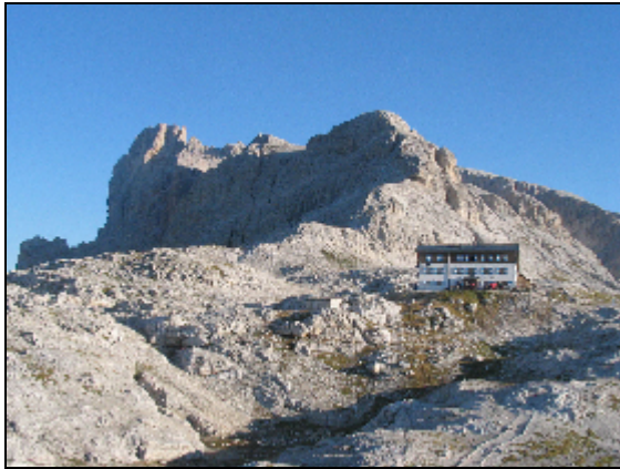
Rifugio Rosetta mit La Rosetta

Fiamme Gialle (3.005m) auf der Südschulter des Cimon della Pala. Um vor 12.00 Uhr erreichen wir das Biwak und sitzen dort lange in der Sonne und genießen das Bergpanorama. Dann machen wir uns auf den bekannten Abstieg durch das Val Strut und erreichen zur Cappuccino- und Apfelstrudelzeit das Rifugio Rosetta.